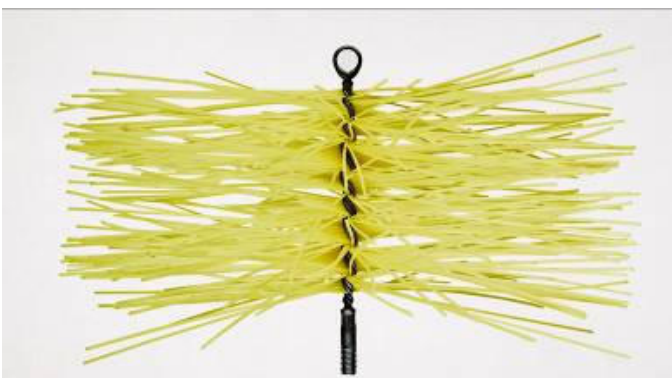
Универсальная щетка для чистки дымохода

Универсальная щетка для чистки дымохода HANSA – прекрасный выбор хозяина отопительного прибора в силу еще одной своей особенности. Имеющийся в комплекте набор соединяющихся между собой ручек щетки позволяет чистить трубы не только различной формы, диаметра, но и разной длины. Ручки обладают достаточной гибкостью, что позволяет не только легко проникнуть сквозь самые неудобно расположенные отверстия дымохода, но и легко управлять движениями во время чистки.