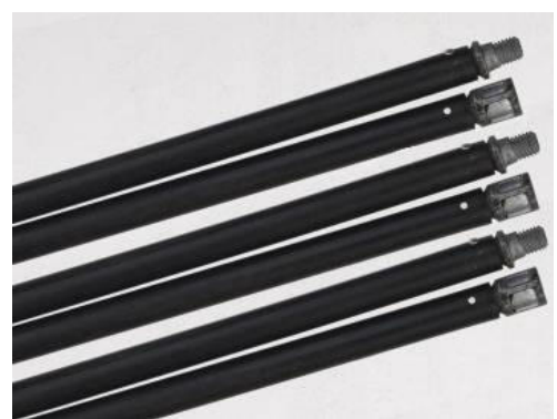
Гибкие ручки щетки (длина 1м, 6 шт.)

EAN код 4779022360558 Количество в упаковке: 1 шт.