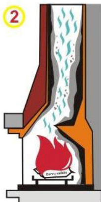
2 Очиститель от сажи покрывает слой этого опасного налета активными газами.