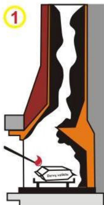
1 Детали отопительного прибора и дымоход покрываются смолистыми отложениями.